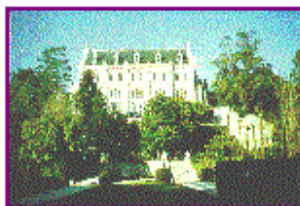
Le château Valrose

Modifier votre document xhtml de base, en insérant une l'image avec une taille réduite de 150x100 pixels